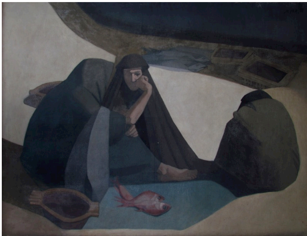
Figura 5: Jacira de Carvalho Oswald. Mulheres de Nazaré , 1958. Óleo sobre tela, 107 x 139,5 cm. Coleção Museu D.João VI, RJ.

O Museu Dom João VI também possui em seu acervo o desenho “Estudo para Tiradentes” de Bandeira de Mello (fig.6). Trata-se de um dos estudos realizados para a figura central de um projeto para um painel. 10 A composição é construída por blocos. Se o lado direito do manto de Tiradentes insinua uma profundidade sinuosa que nos conduz para o bloco de soldados em perspectiva, o lado esquerdo da roupa ganha um acento linear acidentado, que reforça a bidimensionalidade da imagem. Acento que se repete na cabeça tombada do mártir, parte importante do contexto temático. Seguindo os conceitos de linear e pictórico propostos por Wölfflin, esses trabalhos se aproximam do estilo linear, categoria que o historiador associou aos antigos mestres do Renascimento, em contraposição a dissolução da mancha de muitos artistas do Barroco. 11