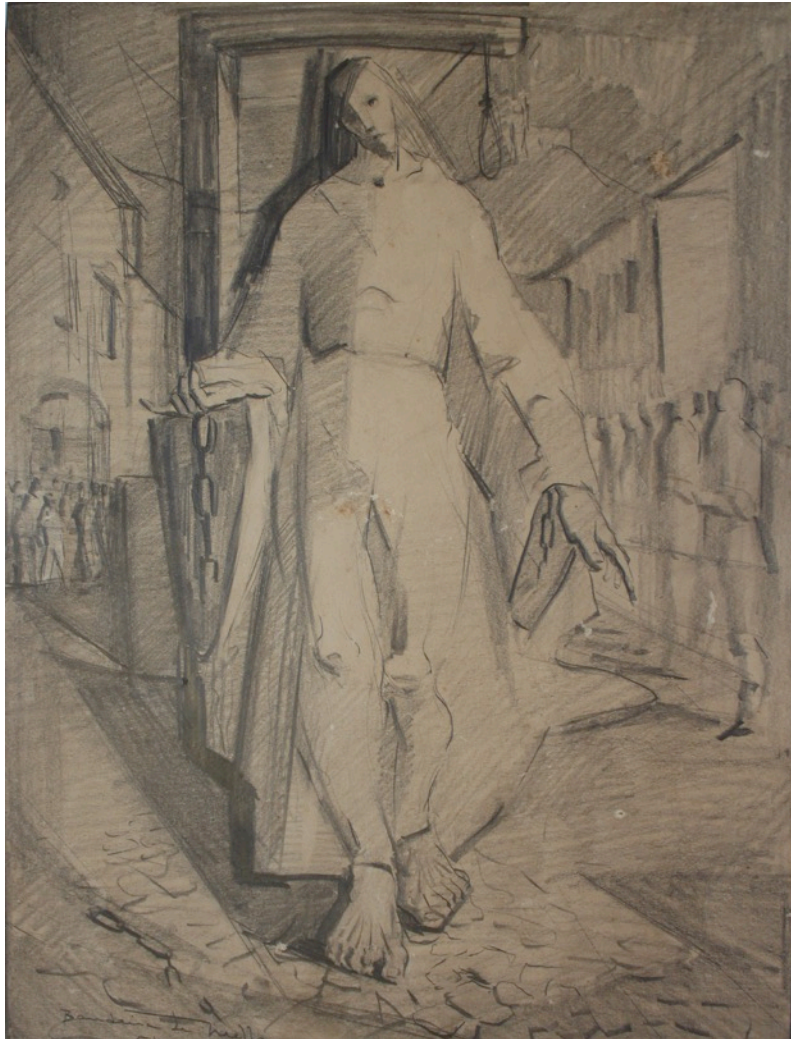
Fig.6: Estudo para Tiradentes. Grafite sobre papel

impressionistas: Van Gogh, Gauguin e Cézanne. A obra de Quirino conta com pesquisas semelhantes às discutidas nesta comunicação, como o interesse pela geometrização da forma e a busca pela síntese, além do empenho pela temática social, que será marcante nessa época.