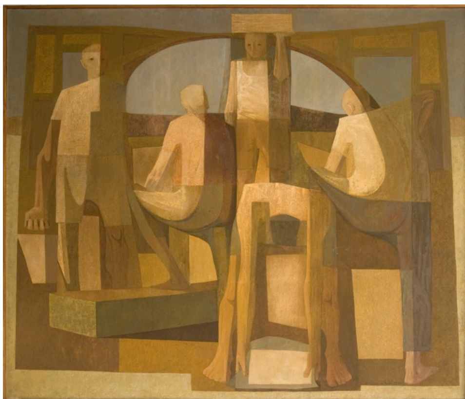
Figura 1: Sem título , 1960. Têmpera e óleo sobre tela, 205 x 190cm.

Ao analisar a produção pictórica de Bandeira de Mello, realizada nas décadas de 1950, 1960 e 1970, percebemos uma série de trabalhos com um forte caráter geométrico. Tais obras passeiam por diferentes temáticas, mas sempre explorando o significado simbólico da figuração.