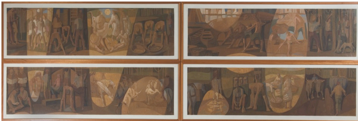
Fig.3: Projeto para painel da Caixa Econômica Federal, 1974. Grafite sobre papel montado em madeira, 160 x 42 cm cada.

criam formas orgânicas independentes, compondo o ritmo principal da obra (fig.4). Este é o cerne desta composição, e costuma ser a etapa inicial de seu processo de criação.